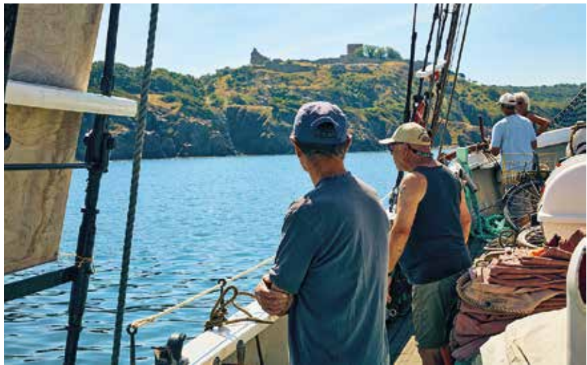
En solnedgangstur forbi Hammershus er en god fælles oplevelse.

Et flok ildsjæle og en bred folkelig opbakning har sikret det 130 år gamle skib en værdig pensionisttilværelse på klippeøen, hvor kølen i sin tid blev lagt. Nu arbejder støtteforeningen Freias Venner målrettet på at holde hende flydende og give medlemmerne gode oplevelser.