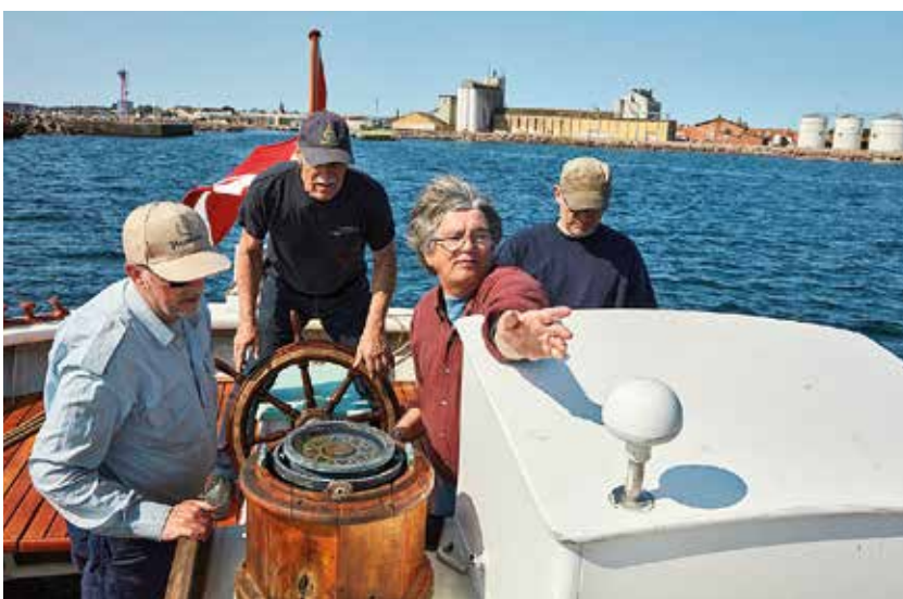
Der skal være nogen til at sejle Freia, så det er godt, at der er søfolk blandt medlemmerne af Freias Venner.