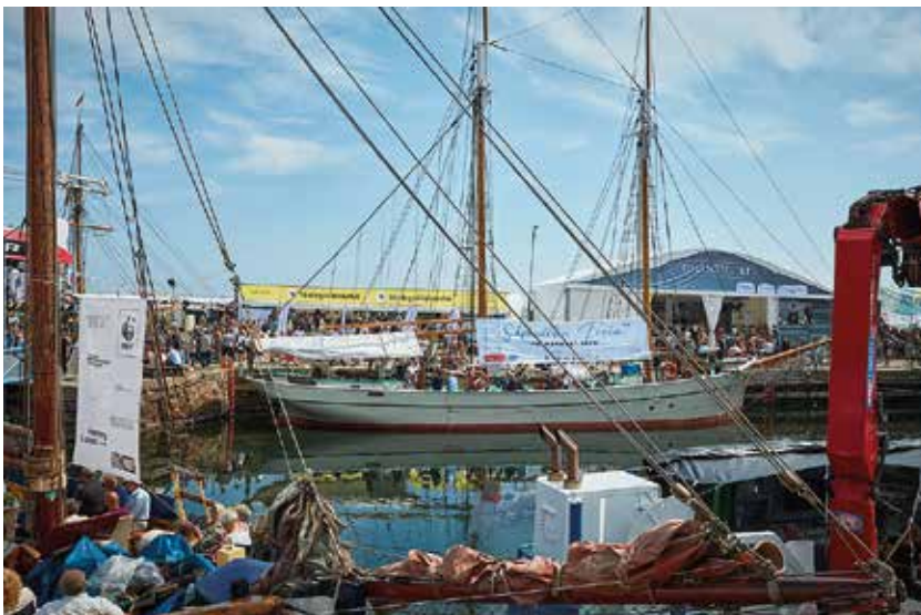
I juni sidste år lagde Freia til i Allinge for at fungere som base for Danmarks Naturfredningsforening under Folkemødet